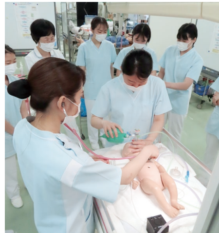
新生児蘇生法トレーニング