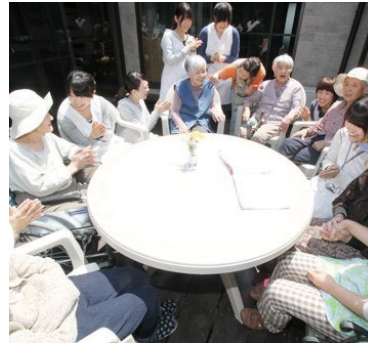
人生の先輩から生き方を学びます