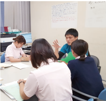
自己を知る事が心の看護の基本です