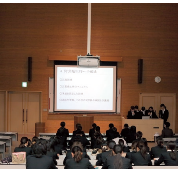
自ら計画を立て、実施した実習の成果を発表します