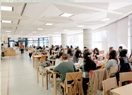
学生ホール・食堂