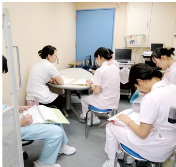
療養生活を支える看護を学びます