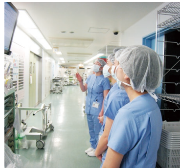
術衣を着ると緊張感が走ります