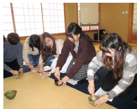
香港中文大学学生茶道体験