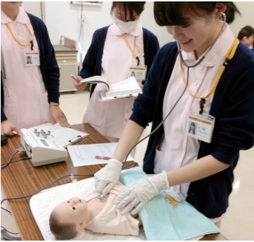
新生児と母親の命を守ります