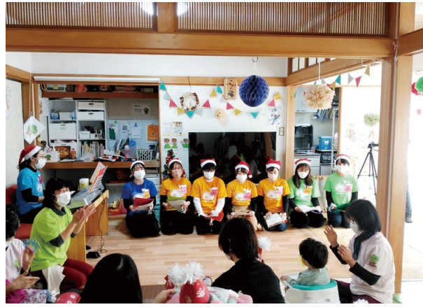
ミュージックボランティアクラブ