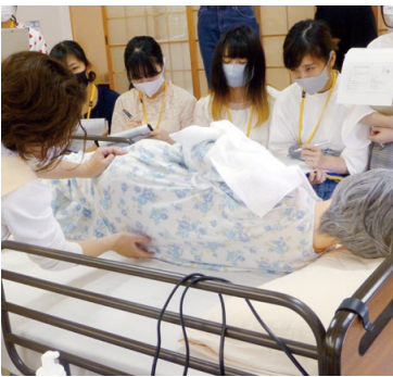
自宅での療養を支えます