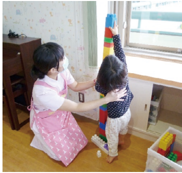
子どもの成長・発達を支えます