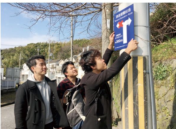
Wakayama Will (災害ボランティアサークル)