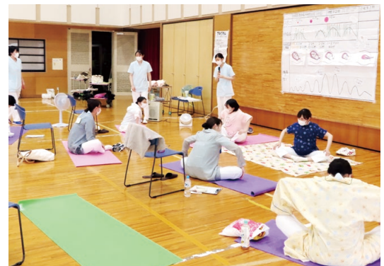
母親学級の学内発表